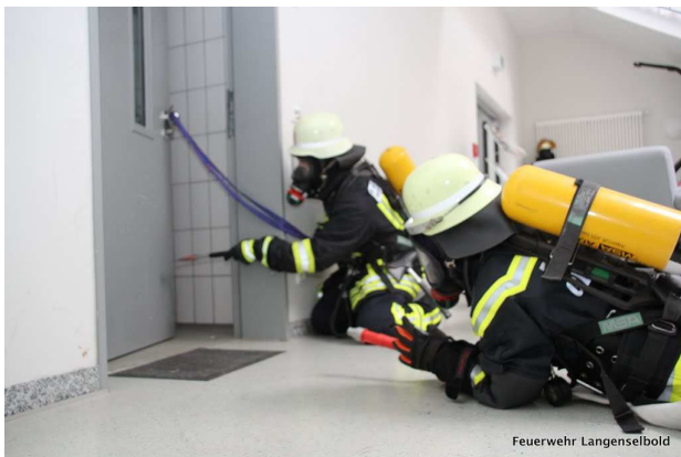
Richtiges Vorgehen in einen verrauchtem Bereich Atemschutzgeräteträgerlehrgang