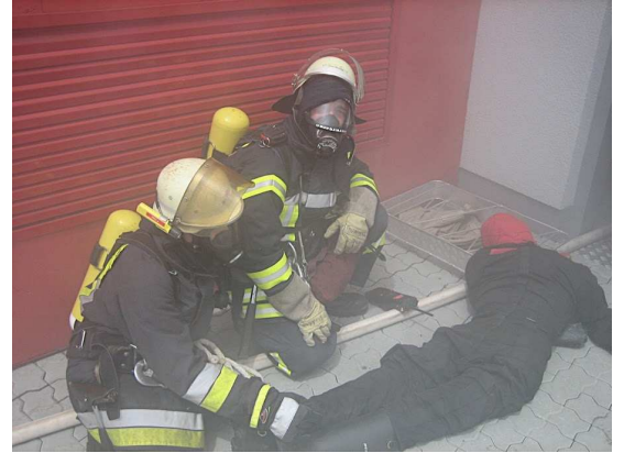
Personenrettung unter Atemschutz Truppführerlehrgang