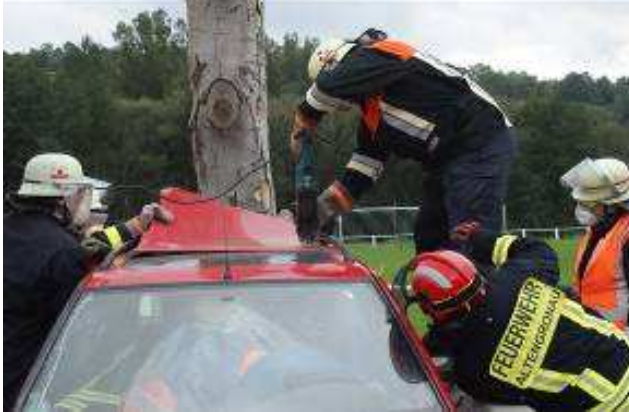
Durchführung einer Patientenorientierten Rettung Technische Hilfeleistung